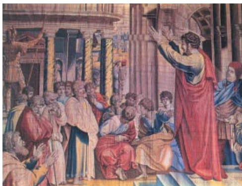
Pau predica el Crist ressuscitat a l'Areòpag d'Atenes. Tapís del segle XVI. Palau Reial. Madrid

La piedra que desecharon los arquitectos / es ahora la piedra angular. / Es el Señor quien lo ha hecho, / ha sido un milagro patente. / Éste es el día en que actuó el Señor: / sea nuestra alegría y nuestro gozo. R.