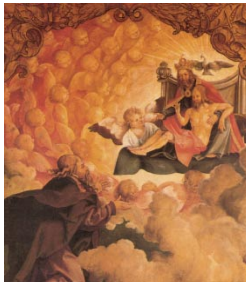
Sant Pau diu d'ell mateix que «va ser endut fins al tercer cel i va sentir-hi paraules inefables que als humans no és permès de repetir» (2Co 12,1-4). (Quadre de Kulmbach. Galleria degli Uffizi, Florència)

Beneït el qui ve en nom del Senyor. / Us beneïm des de la casa del Senyor. / Vós sou el meu Déu, us dono gràcies, / us exalço, Déu meu! / Enaltiu el Senyor: Que n'és de bo! / Perdura eternament el seu amor. R.